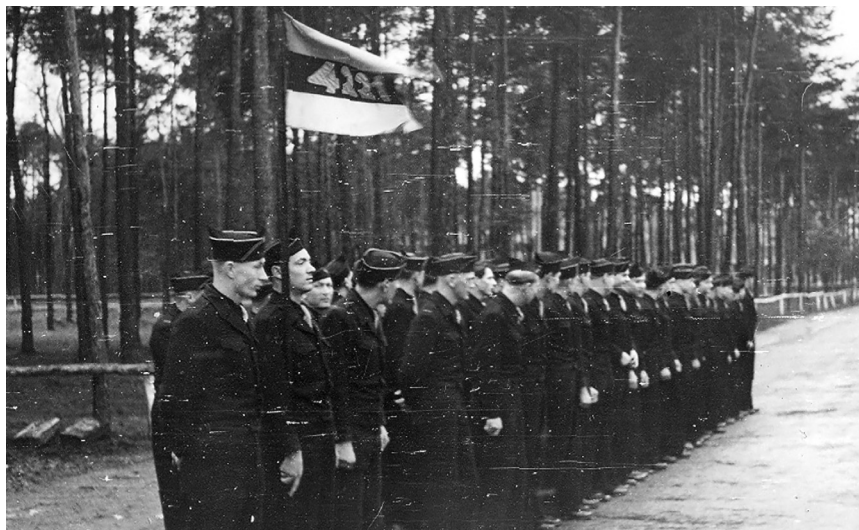
4221. vahikompanii rivistus.

ennekõike head tervist ja sõjaväelist väljaõpet. Hiljem selgus, et 92 protsenti vastuvõetuist olid endised 20. eesti SS-diviisi võitlejad ja lennuväe abiteenistujad. 40 Veel enam, Ameerika Ühendriikide DPde Komisjoni Peakorteri ( US Displaced Persons Commission Headquarters ) otsusega ei saanud ka Relva-SSi kuulumine takistuseks USAsse emigreerumisel.