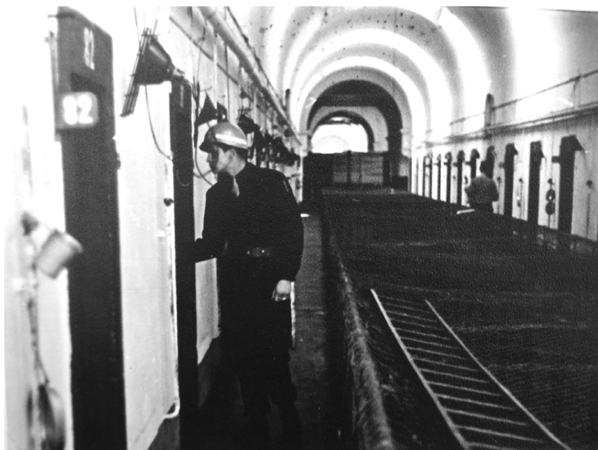
Nürnbergi vanglas, esiplaanil eestlasest vangivalvur.