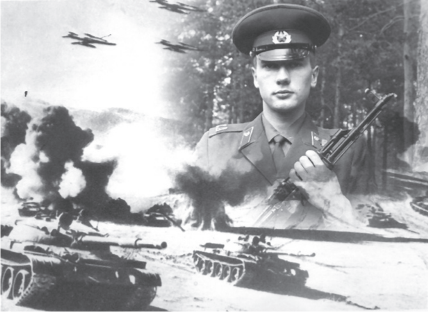
Selliseid propagandakollaaže võis tellida väeosa fotograafilt. This type of propaganda collages were compiled by military units' photographers