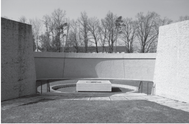
Õhuväe mälestusmärk Fürstentfeldbruckis