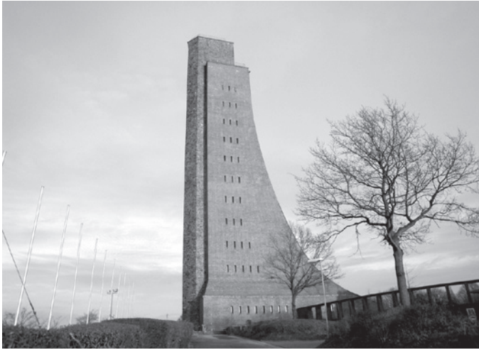
Laboe mereväe mälestusmärk