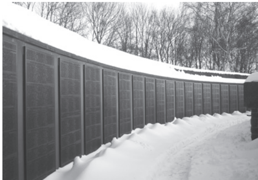
Möntenort, Gallery with bronze plaques

bund, DMB) võttis 30. mail 1954 mälestusmärgi haldamise üle, muudeti pühendust ning sellest sai mälestusmärk „kõigi riikide ja rahvaste mere-meestele, kes on merel hukkunud, ning ühtlasi ausammas rahumeelsele laevasõidule vabadel meredel”. 13