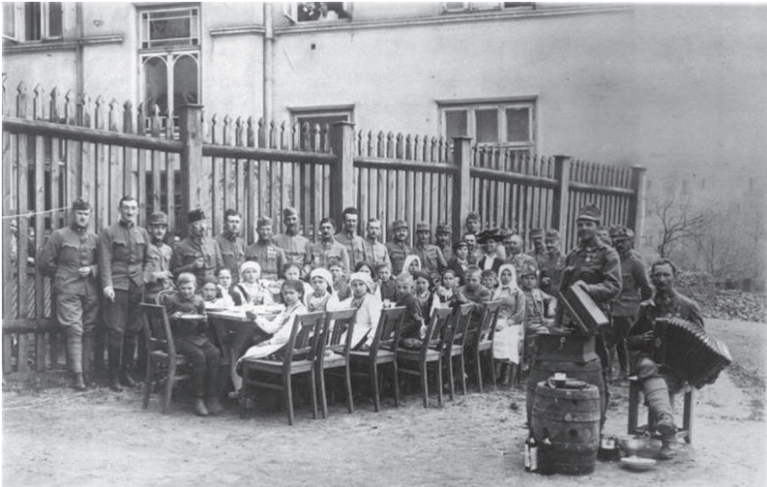
Austria-Ungari sõjaväelased okupeeritud Poolas poola lapsi võõrustamas.