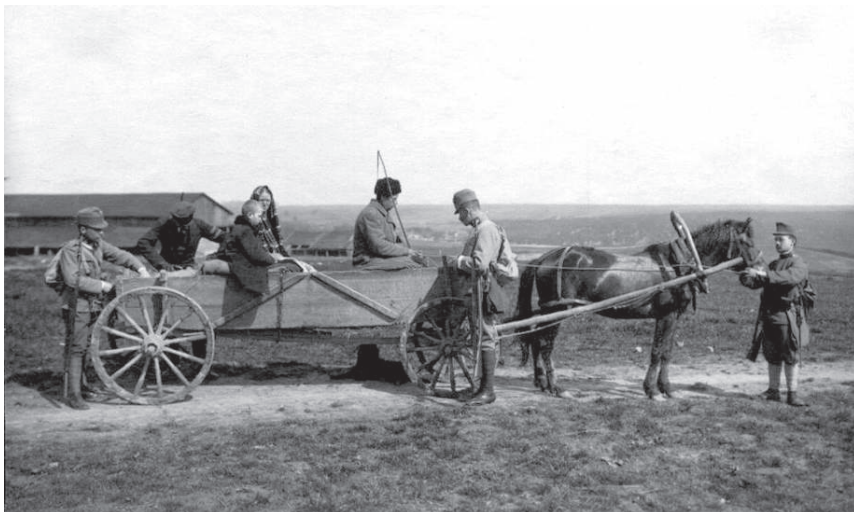
Austria-Ungari sõjaväepatrull okupeeritud Poolas Lublini lähedal talupoja vankrit inspekteerimas. Austria Riigiarhiiv, Sõjaarhiiv, fotokogu, Poola, nr 1560

menetlemisse. Tsiviilhalduse osakond esindas leebeimat, kompromissialtimat suunda, ülemjuhatus majandusküsimuste eest vastutavad allüksused, kelle südameasi oli armeede varustamine, nõudsid halastamatut eksploateerimist; eriti teravat tooni üritas aga hoida maaväe ülemjuhatus luureosakond. 44