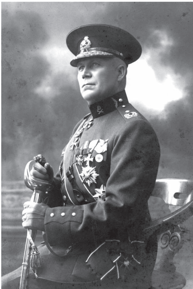
Kindralmajor Aleksander Tõnisson kannab 1926. aasta vormil vasakul Püha Vladimiri 4. järgu ordenit mõõkade ja lehviga, selle kõrval Poola Vapruse Risti ja Eesti Punase Risti mälestusmärki, mille kohal on Vabadussõja mälestusmärk.