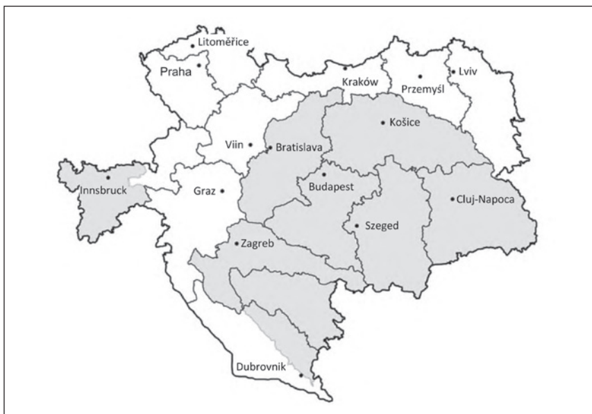
Skeem 2. Austria-Ungari territoriaalkaitseringkonnad: halli värviga on tähistatud sõjaväelise autonoomiaga piirkonnad

olnud ka territoriaal- või maakaitseteenistust. Vastupidiselt Austria või Ungari kodanikele, kes täitsid sõjaväes teenides oma „kodanikukohust“, kasutati Bosnia ja Hertsegoviina elanikke impeeriumi huvides ilma neile kodanikuõigusi tagamata. 52