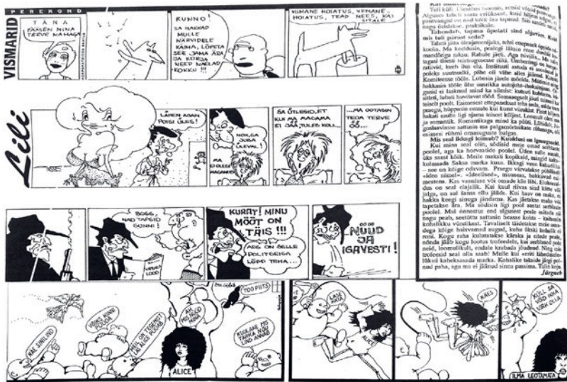
Illustratsioon 4. Koomiksid ajalehes Liivimaa Kuller, 25. XI 1993.

Ülevalt: Korporatsioon Saatuse, riba „Perekond Vismarid“;