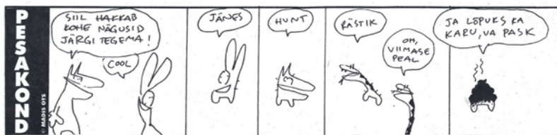
Illustratsioon 1. Madis Ots, riba „Pesakond” ajalehes Post, 14. VI 1994